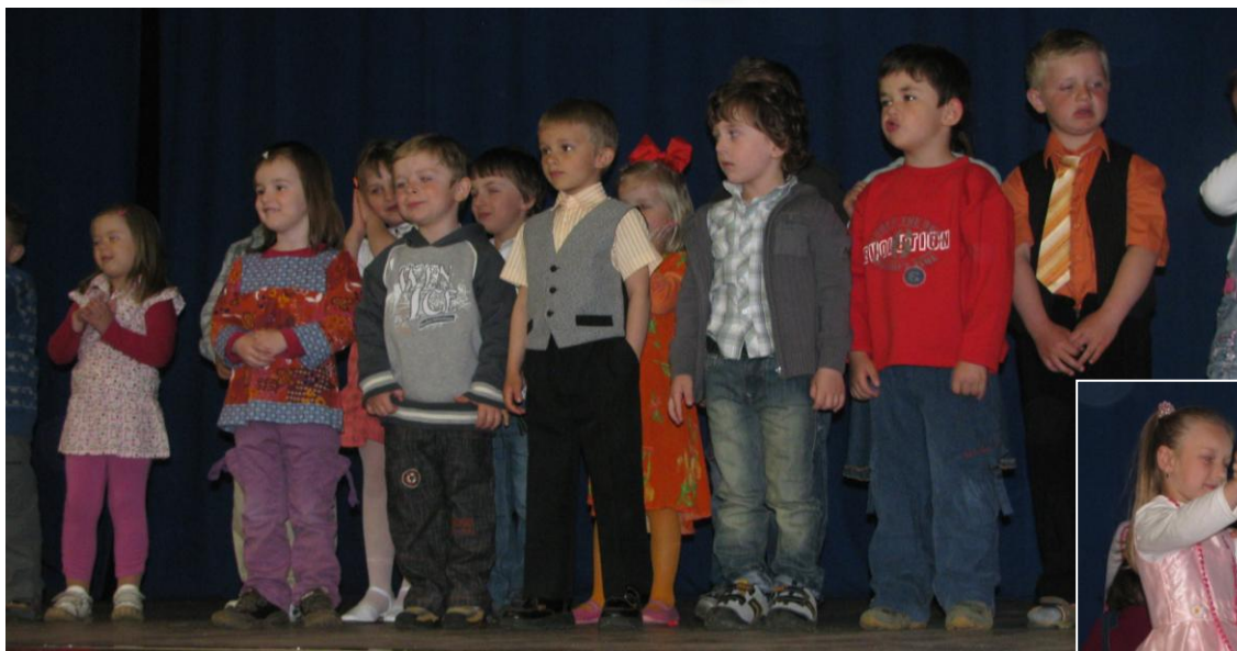
Deti zo základnej a materskej školy potešili mamičky pekným kultúrnym programom.

Za jej štedrosť, starosť v hlave, za dni šťastné, za dni hravé, za rozprávky nad kolískou, za to, že vždy stojí blízko.